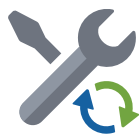
Erstellen, Verwalten und Synchronisieren von eigenen, ortsbezogenen Dateninhalten