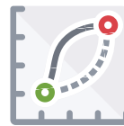
Asset Tracking und Berichtswesen